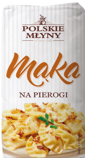
MAKA NA PIEROGI DUMPLINGS DOUGH FLOUR 1 KG WAGA NETTO NET WEIGHT TOREBKA PAPIEROWA / PAPER BAG 10 960 5 900766 004388