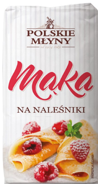
MAKA NA NALEŚNIKI PANCAKE FLOUR 1 KG WAGA NETTO NET WEIGHT TOREBKA PAPIEROWA / PAPER BAG 10 960 5 900766 004371