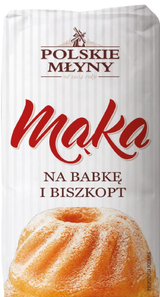
MAKA NA BABKĘ I BISZKOPT SPONGE CAKE FLOUR 1 KG WAGA NETTO NET WEIGHT TOREBKA PAPIEROWA / PAPER BAG 10 960 5 900766 004357