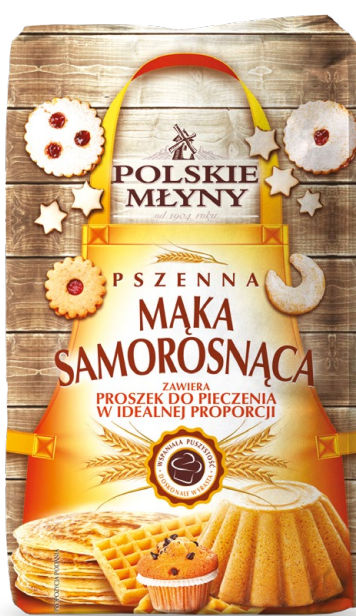
MAKA SAMOROSNĄCA PSZENNA TYP 480 SELFRISING WHEAT FLOUR TYPE 480 1 KG WAGA NETTO NET WEIGHT TOREBKA PAPIEROWA / PAPER BAG 10 800 5 900766 000359