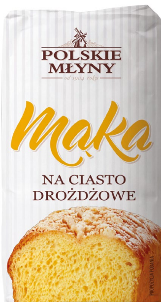
MAKA NA CIASTO DROŻDZOWE YEAST CAKE FLOUR 1 KG WAGA NETTO NET WEIGHT TOREBKA PAPIEROWA / PAPER BAG 10 960 5 900766 004364