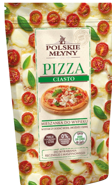
MIESZANKA DO WYPIEKU PIZZY PIZZA PREMIX 500 G WAGA NETTO NET WEIGHT TOREBKA PLASTIKOWA / DOYPACK 9 756 5 900766 003220